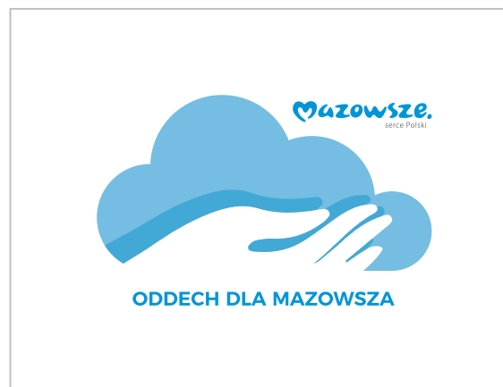
Dopuszczalne stosowanie logo na jednolitym tle