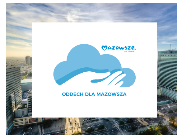
Dopuszczalne stosowanie logo na niejednorodnym tle