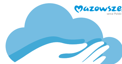
Dopuszczalne stosowanie logo bez hasła